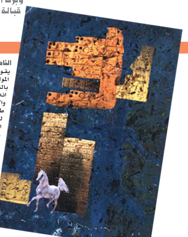
بيع منهوثة آثارية بـ ٥٧ مليون دولار