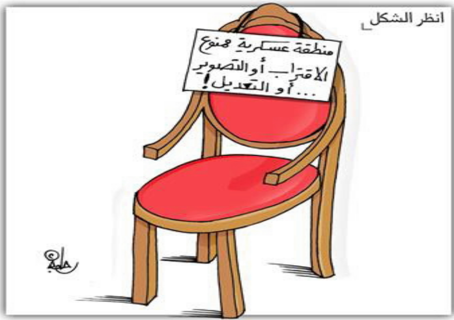
عن السفير اللبنانية