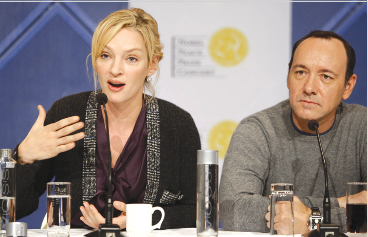
الممثلة الأمريكية اوما ثورمان والنجم الأمريكي كيفن سباسي في مؤتمر صحفي قبل حفل توزيع جوائز نوبل في اوسلو

نيويورك / وكالات انضمت سيدة ولاية نيويورك الأولى سيلدا وول- سبيتزر إلى مئات من أطفال المدارس للكشف عن تشكيل ضخم مكون من ١٠٠ مليون قطعة من عملة "البنس" المعدنية بلغت في مجملها مليون دولار، لصالح الجمعيات الخيرية. وأطلق على التشكيل المعدني، الذي يمتد على مدى ٥٠ متراً وعرضه ٩ أمتار (X30١٦٥ قدما)، مسمى "حقل حصاد البنسات"، نقلًا عن الأسوشيتد برس. ويدخل المهرجان الذي تنظمه جمعية Common Cents غير الربحية، وهو المهرجان ال١٧٦، في إطار برنامج تثقيفي يهدف لتعليم الأطفال أذواهم كمساهمين تجاه المجتمع. وأمضى مئات الآلاف من الطلاب، من أكثر من ٨٠٠ مدرسة، الأسابيع القليلة الماضية في طرق أبواب المدينة لجمع التبرعات من "البنسات". وستقدم التبرعات إلى جمعيات خيرية، يختارها الأطفال، مهتمّة بقضايا البيئة أو رعاية المسنين. وسيعرض "حقل حصاد البنسات"، في مركز "روكفيلر"، بالقرب من شجرة الميلاد الشهيرة حتى نهاية العام الحالي.