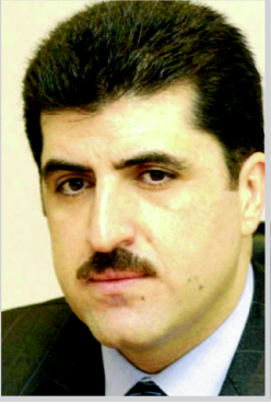
بغداد/ المدكا بدأت امس السبت الاجتماعات الرسمية بين

الدستور الخاصة بالوضع في محافظة كركوك، وقضية عقود النفط التي وقعتها حكومة الإقليم، وكذلك قضية تخصيصات قوات حماية إقليم كوردستان "البشمركة" وميزانية العام المقبل. وأضاف عثمان إن هناك "أجواء إيجابية سبقت" المحادثات، ورغبة حقيقية بالوصول إلى فهم مشترك بين الطرفين، ومن المأمول إن تثمر المباحثات عن نتائج موفقة. ووصل نيجيرفان بارزاني إلى بغداد، الاثنين