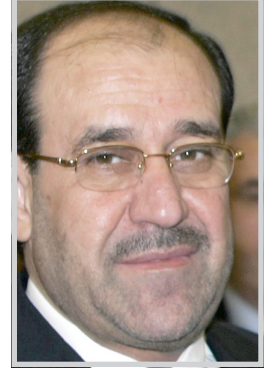
نيس الوزراء نوري المالكي ورئيس وزراء إقليم كردستان العراق

نيجيرفان بارزاني في بغداد. وقال النائب عن التحالف الكردستاني الدكتور محمود عثمان في تصريح صحفي إن الاجتماعات التي سبق أن عقدها بارزاني مع كل من المالكي، ورئيس الجمهورية جلال طالباني ورئيس كتلة الائتلاف العراقي الموحد السيد عبد العزيز الحكيم، كانت اجتماعات تشاورية غير رسمية، مبينا إن "اجتماع السبت يعد الرسمي، وسيتناول قضايا المادة ١٤٠ من