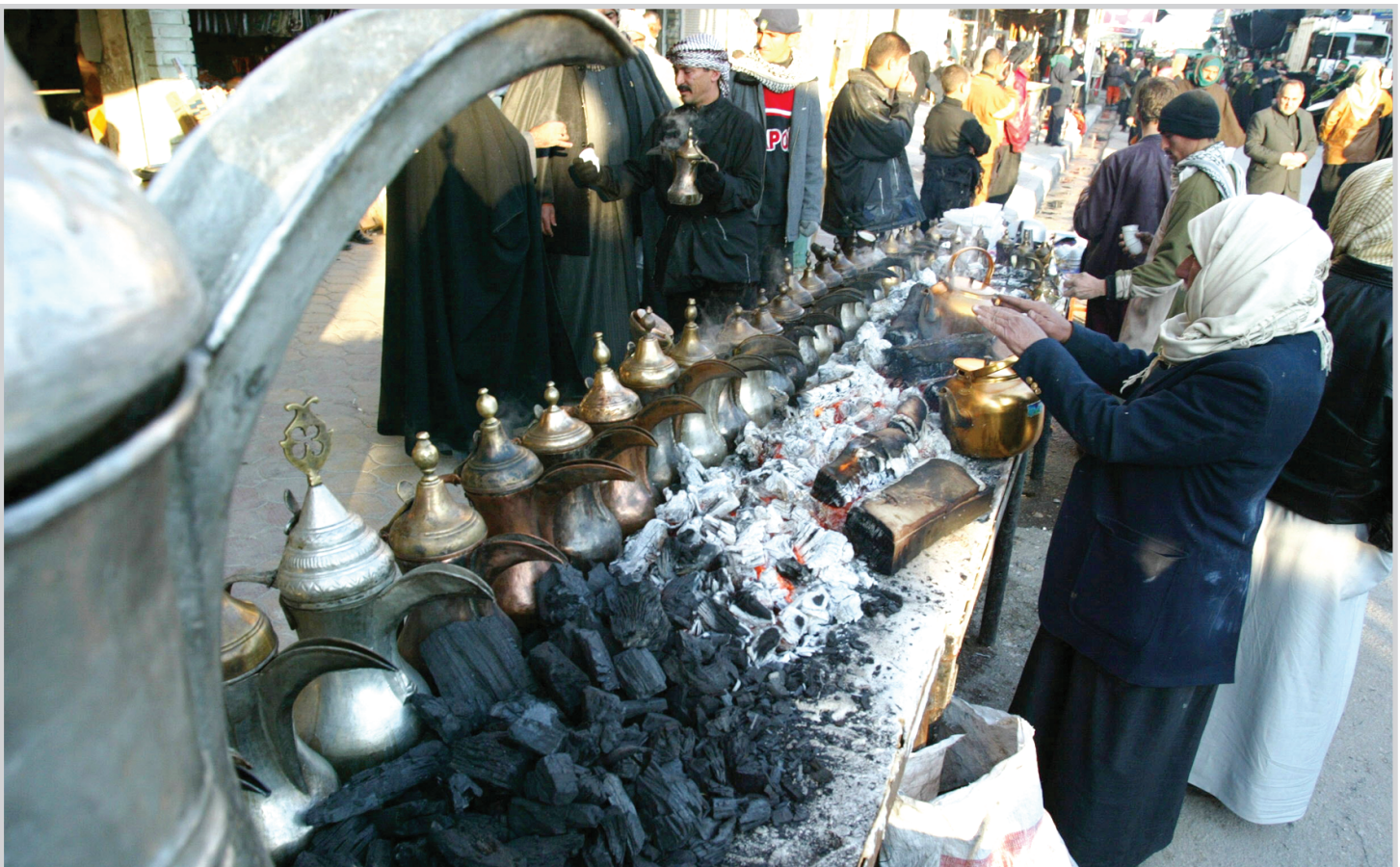
في الطريق إلى كربلاء

الجوار بأن الامور ستنتج". وعبرت عن اعتقادها بان "عراقاً ديمقراطياً موحداً موجود هنا لكي يبقى رغم وجود بعض التحديات". واضافت ان "زيادة عديد القوات (الاميركية) لإعطاء الشعب العراقي فرصة للمصالحة الوطنية لكن هذه العملية لم تتحرك دائماً بالسرعة التي نرغب فيها او يودها البعض في واشنطن (...) لكن العملية تسير بشكل رائع". وفي ختام محادثات استمرت ساعتين، اصدر مكتب المالكي بياناً يؤكد ان "الحكومة تعمل على تثبيت اسس الديمقراطية والحرية والعدالة وسيادة القانون واشاعة اجواء المصالحة الوطنية في العراق الجديد". واضاف ان "سياستنا الخارجية تنسجم مع مصالحنا الوطنية وتطلعات شعبنا، واننا حريصون على بناء افضل العلاقات مع الولايات المتحدة وجميع دول العالم، ونعمل على اعادة الثقة والتواصل مع المجتمع الدولي في المجالات السياسية والاقتصادية، وازالة آثار السياسات الخاطئة التي انتهجها النظام المباد". وتابع البيان ان راييس "جددت دعم الولايات المتحدة للحكومة العراقية، ومساندة جهودها لتحقيق الامن والاستقرار والرفاهية لآبناء الشعب العراقي كافة، واستكمال السيادة وتطبيق القانون والوقوف الى جانبها في إنجاز مشاريعها".