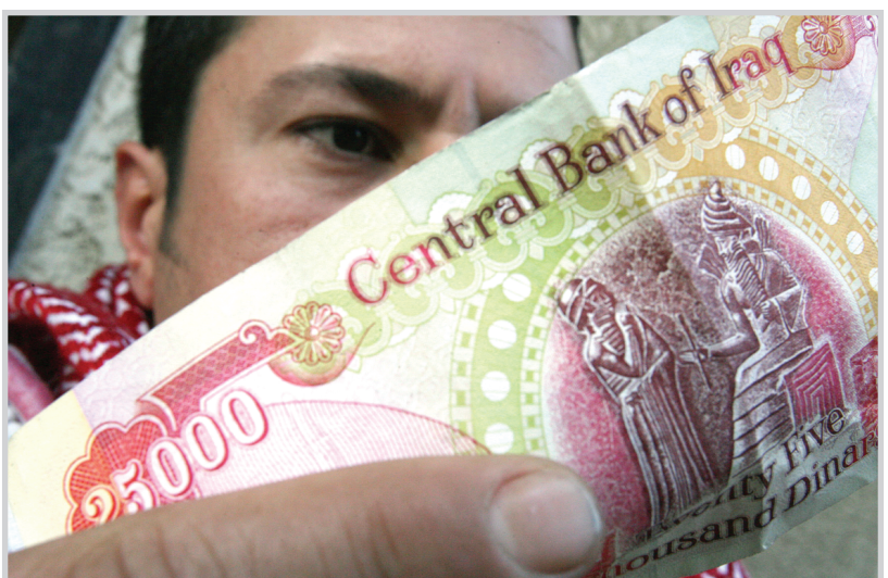
الأموال نجت من الحريق

واكد المصدر بحسب البيان "استمرار البنك في عملياته المصرفية ونشاطاته التي تواصلت الثلاثاء". وعبر عن تقديره وشكره الحكومة والقطاع المصرفي الحكومي والخاص على مساعدتهم الداعمة في مساعدة البنك المركزي