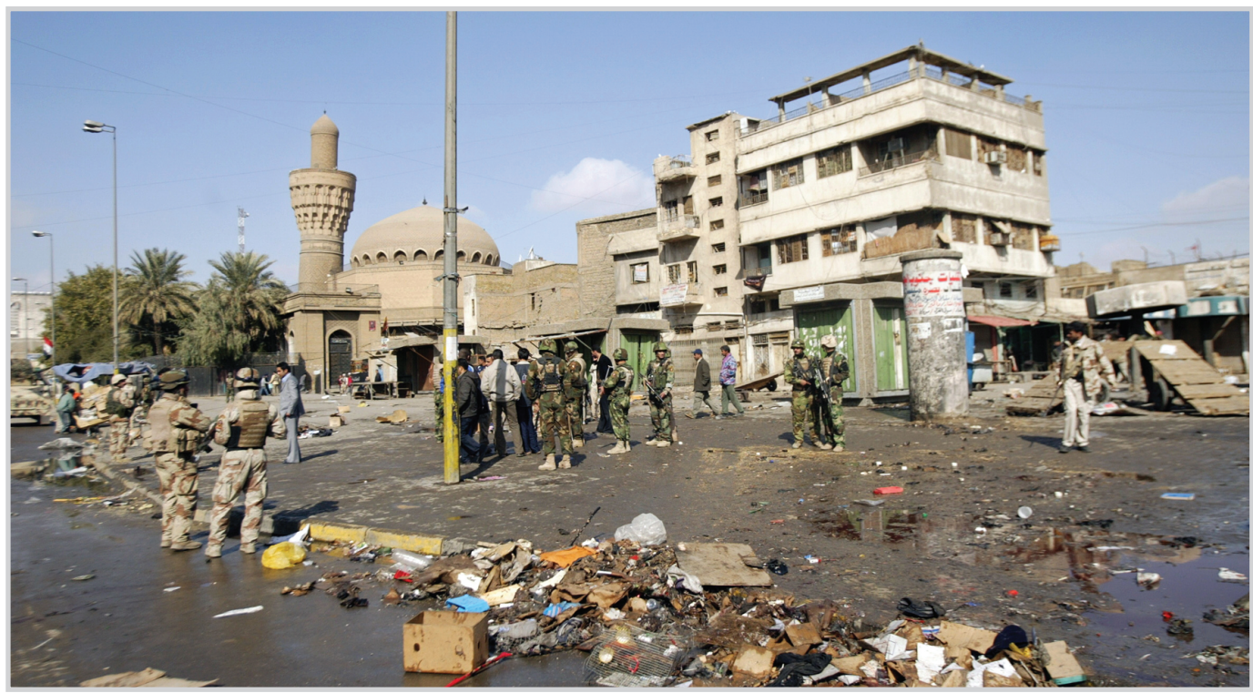
استهداف متكرر لسوق الغزل .. امس الجمعة

بغداد / الصداق ادى هجومان انتحاريان استهدفا مدنيين في سوقين لبيع الطيور والحيوانات الاليفة الى استهداف ٥٤ واصابة ١٧٦ بجروح. وقال الناطق باسم خطة فرض القانون اللواء قاسم عطا ل(المدى) ان الانفجار الاول حدث صباح امس الجمعة عندما قامت انتحارية بتفجير نفسها في سوق الغزل، وبعده بقليل استهدفت انتحارية اخرى ترتدي حزاما ناسفا في سوق للطيور في منطقة بغداد الجديدة ما ادى الى استهداف ٥٤ واصابة ١٧٦ آخرين بجروح في حصيلة للانتحاريين. وفي هذا الاطار اصدر مكتب رئيس