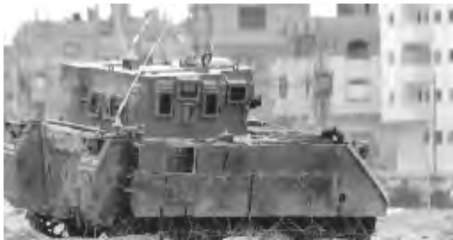
المصرية اسفرتا عن مقتل سبعة اشخاص على الاقل وجرح ٢٠٠. وقد قتل فلسطيني آخر بانفجار قنبلة.

مسيرها الى ان (بيع ٢٢ طائرة ايرباص تمثل ٨٠٪ من هذا الربعة الاف طن. و اضاف لوس ان قطر صدرت الى فرنسا بضائع بقيمة ٨٢ مليون يورو في ٢٠٠٢. وسيني لوس جولته في الامارات العربية المتحدة. وقال متحدث باسم سفارة فرنسا في ابو ظبي انه سيلتقي غدا الثلاثاء مسؤولين فرنسا في قطر في ٢٠٠٢ بلغت ٧٠ مليون يورو (٩١٦مليون دولار)،