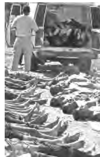
الانقاذ ان (وفاة عدد كبير من السجناء عن اختناقهم بالذخاان الذي عرقل ايضا عمل افراد فرق الانقاذ على حد قولهم.

الاعتداءات المتواصلة والانتهاكات المستمرة من قبل اسرائيل على الشعب الفلسطيني الاعزل وانتهاكاتها المستمرة للاعراف والقوانين الدولية مما يستدعي فرض عقوبات عليها).