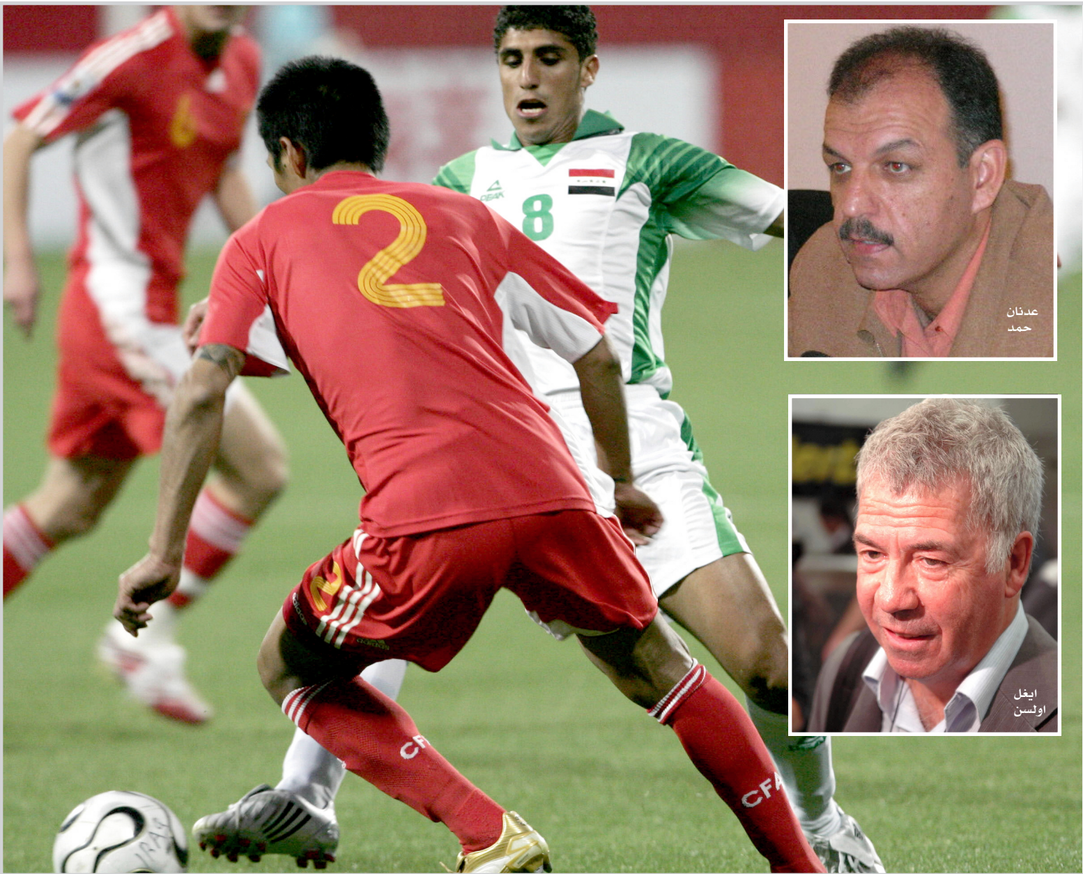
غياب الروح القتالية امام الصين اسقطت منتخبنا في مصيدة التعادل

اولسن سيتعب في فهم ثقافة اللاعبين .. وضربة المعلم شحاته درس لكل العرب