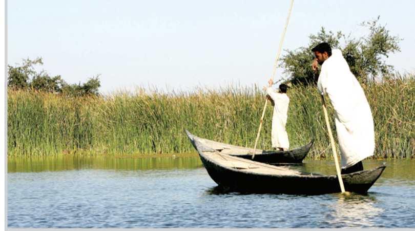
الأهوار والازدهار المنتظر

بناء منشآت ضخمة في منطقة الأهوار بإيد عراقية. وقال سنبحت عن معامل متخصصة لبناء هذه المنازل وشراؤها من اجل ان تتولى اعمال البناء بافستنا. وأشار الساري الى ان الوزارة اتخذت عدة اجراءات جديدة لتنفيذ مشاريع الأهوار منها متابعة تلك المشاريع بشكل مباشر كما تم تشكيل لجنة وزارية، تضم ممثلين من ستة وزارات اخرى، حيث تم تحويل ممثلي وزارتنا بالاشراف على أي مشروع ينفذ بهدف السيطرة على عملية تنفيذ تلك المشاريع وعدم استحصال الموافقة على صرف المبالغ من وزارة المالية إلا بعد حصول موافقة وزارتنا عليها وتأييدها وقد تم الاتفاق مع وزارة المالية حول هذا الموضوع. ونوه الساري الى ان مناطق الأهوار تعد من المناطق الأكثر أمناً في عموم البلاد فيما أكد على ان الجانب الإيطالي ابدى استعداده لتقديم تضاميم