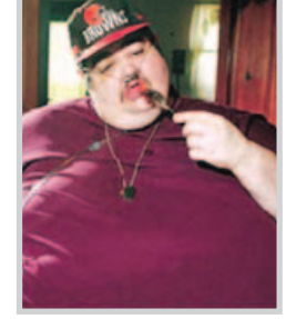
الاسترالية لكن المؤسسة نفت ان تكون تواجه اي مشاكل في التوظيف.

سيدني / وكالات زادت مؤسسة البريد الاسترالية حدها الاقصى لوزن ساعة البريد من الرجال والنساء ١٥ كغم في محاولة لاجتذاب مزيد من ساعة البريد. وكانت مؤسسة البريد الاسترالية "استراليا بوست" تضع حدا أقصى للوزن ٩٠ كغم لساعة البريد لان دراجتها النارية البالغة سعتها ١١٠ سي سي تعمل بامان في حدود وزن ١٣٠ كغم ٤٠ كيلوجراما للرسائل وما يصل الى ٩٠ كغم لساعة البريد من الرجال والنساء بملابسهم