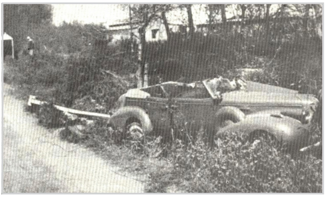
سيارة الملك غازي بعد الحادث مباشرة

مقتل الملك غازي بالصورة التي اظهرت للناس اثار كثيرا من الشكوك حول الرواية الرسمية التي قدمتها الحكومة عام ١٩٣٩ الكاتب والديبلوماسي نجدت صفوة حاول البحث عن اسرار مصرع الملك غازي في الوثائق البريطانية التي نشرت قبل اكثر من ثلاثين سنة ان اسرار مصرع الملك غازي ستبقا لغزا صحيرا للدارسين عن هذه القضية التي يؤكد الباحث نجدة فتحيا صفوة قائلاً: