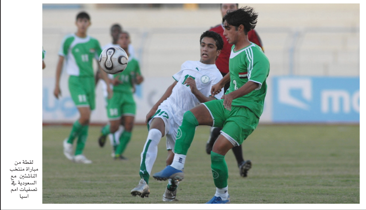
لقطة من مباراة منتخب الناشئين مع السعودية في تصفيات أمم آسيا

حراسنا بصورة عامة يتمتعون بالشجاعة والموهبة الا ان ماينقصهم هو التدريب الحديث وتصحيح التكتيك العام بالتدريب المتواصل اضافة الى التركيزعلى الصفاءالذهني الذي يفتقده اغلب الحراس العراقيين.