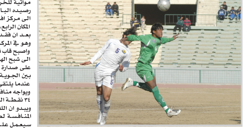
لقطة من مباراة الزوراء والشرطة في دوري الموسم الحالي

مواجهة للخروج بانتصار ثمين يرفع به رصيده الباطح الآن ٢٤ نقطة ويصعد الى مركز أفضل من موقعه الحالي في المكان الرابع، ولا يهم لقاء الشعلة كثيرا بعد ان فقد الاول في تحسين مكانه وهو في المركز قبل الاخير من القائمة واصبح قاب قوسين او ادنى من التعرض الى شبح الهبوط. ويشهد السبق المثير على صدارة جدول المجموعة مرة اخرى بين الجوية المتصدر بفارق الاهداف عندما يلتقي النقط على ملعب الاخير ويواجه منافسه الشرطة الثاني برصيد ٢٤ نقطة المرادي في هذه المباراة ويبدو ان اللذانين متكافئين لطبيعة المنافسة لطريفة الصراع فالرمادي سيعمل على بسد كل ما في وسعه