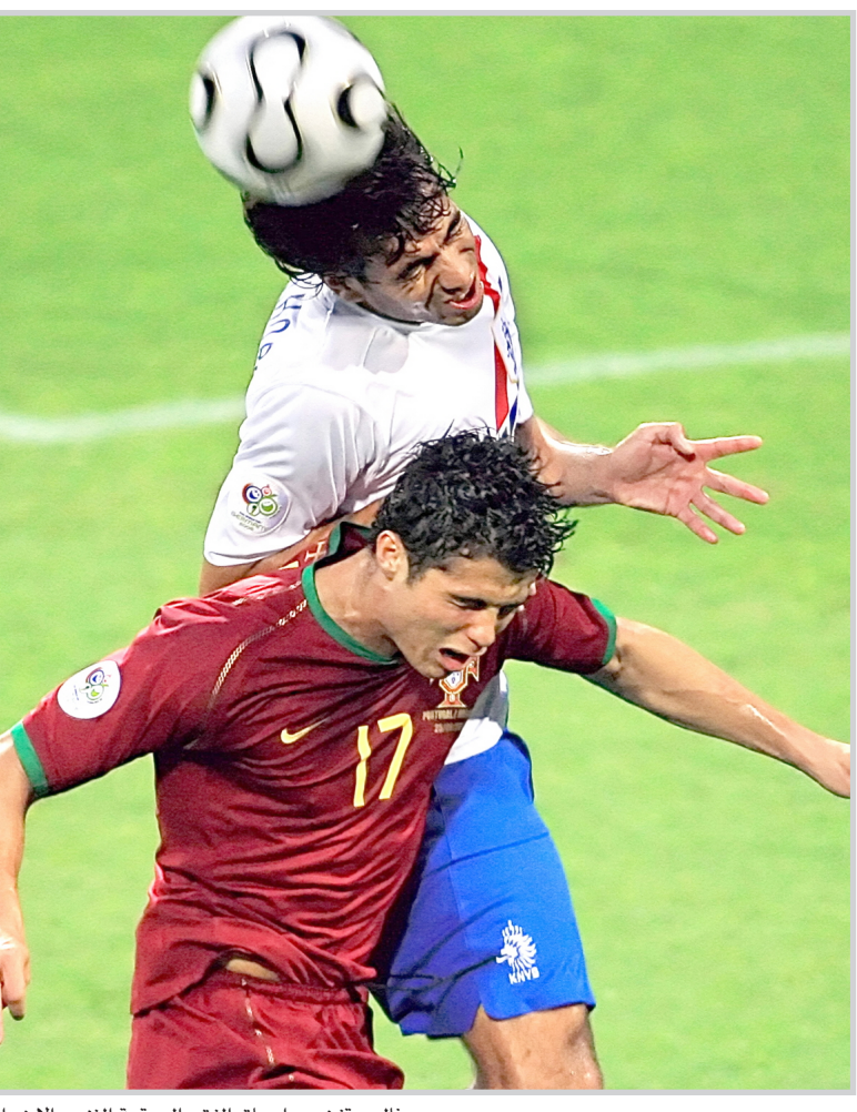
رونالدو قفز من اعماق الفقر الى قمة الغنى والأضواء

و الذي يلعب لتفريق ليون الفرنسي، وهو بالمناسبة زميله في منتخب البرتغال، فيقول: طالما يطلب كريستيانو الكرة أو ينتظرها، فإنه يسهل عليه إيجادها في المكان والزمان المناسبين. واسترجعت المجلة شريط بدايات كريستيانو رونالدو مع مانشستر يونايتد وقالت إنه عند مجيئه للنادي في ٢٠٠٣ لم يكن أحد يتوقع أن هذا اللاعب الصغير الذي يرتدي بظلالون جينز وتي شيرت شبه شفاف ويلبس نظارة شمسية بزجاج في عز الضباب والغيوم، يصبح يوما ما أحد أهم نجوم المان يونايتد. ولم يكن رونالدو وقتها يجيد الحديث باللغة الإنجليزية لدرجة أن أحد الصحفيين سألته عما إذا كانت مسألة التكيف مع الحياة في مانشستر تسغله أو تثير قلقه، رد في اتجاه آخر تماما قائلا: أنا متأكد أن الطقس جميل هنا أحيانا!