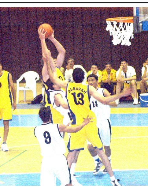
سلة الحلة تتربع على منافسات التجمع الثالث

الديواني حيث استفاد نادي الحلة من عمالي الارض والجمهور مسجلين فوزهم الثاني وبنتيجة ٨٠-٥٩ لتلتي لهم مباراة واحدة من منافسات التجمع خاضوها مع فريق ناي الميناء البصري وانهاها الحلبيون لصالحهم ايضا بنتيجة ٦٥- مقابل ٤٧ للبصريين الذين ودعوا