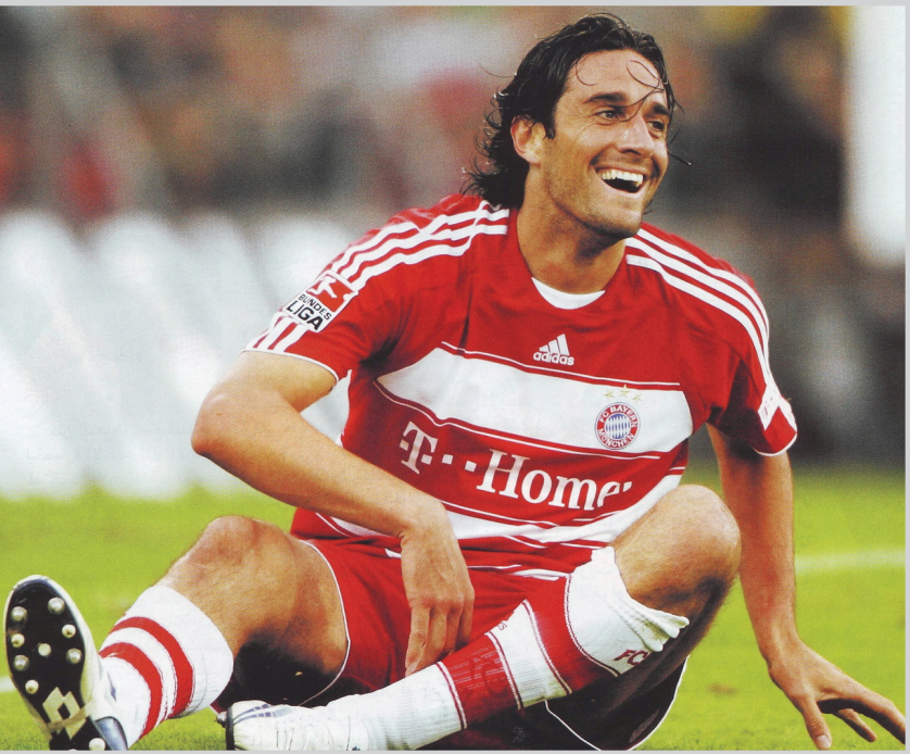
لوكا توني نجم البايرن سجل احد اهداف فريقه

الانكليزي بهدفين دون رد. وافتتح الصربي زدرافكو كوزمانوفيتش التسجيل في الدقيقة ٧١ وأضاف لاعب الوسط ريكاردو مونتوليفو الهدف الثاني في الدقيقة ٨١.