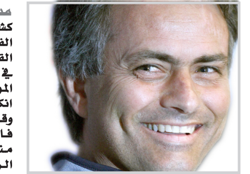
خوزيه مورينو يرغب التدريب في اسبانيا

مدير / وكالات كشف المدرب البرتغالي خوزيه مورينيو المدير الفني السابق لفرق تيفولسي الانكليزي لكرة القدم عن رغبته في تولي مسؤولية أحد الأندية في إسبانيا أو إيطاليا كمحطة تدريبية له خلال الموسم المقبل مستبعداً فكرة عودته للعمل في أنكلترا. وقال مورينيو على هامش تواجه في مدينة هالنسيا الأسبانية لحضور فعاليات تقديم منتج جديد لشركة أديداس للملابس الرياضية: سيروق لي أن أدرب نادياً يلعب في