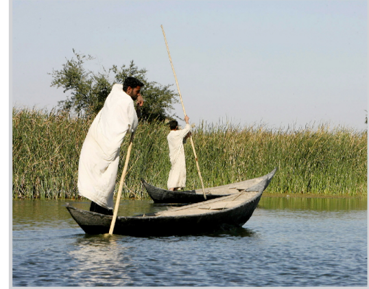
العمارة / المدعي قال مدير زراعة قضاء الميمونة بمحافظة ميسان، أن شركات محلية باشرت بتنفيذ خمسة مشاريع زراعية في مناطق الأهوار الغربية من المحافظة، وبتكلفة إجمالية تبلغ مليار