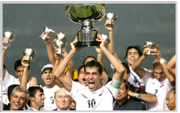
اسود الرافدين يشاركون في بطولة القارات في جنوب افريقيا