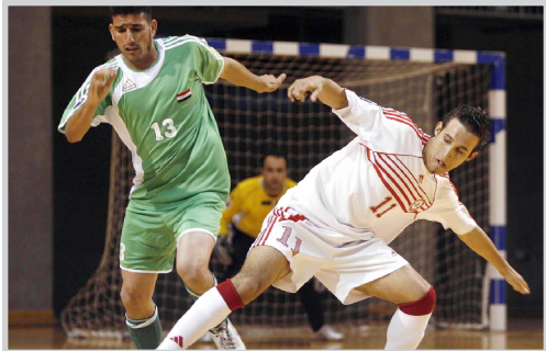
جانب من منافسات خماسي الكرة