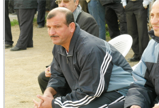
ثار احمد خرج بنقطة ثمانية امام الكهرباء

دون اهداف. في الشوط الثاني لم يتغير الحال واستمر التعادل السليبي بين الفريقين بالرغم من المحاولات المتكررة للفريقين، وكان فريق الكهرباء هو من بدأ الهجمات على الشرطة بعد ان شكل افضلية لصالحه بالرغم من عدم جدوى هذه الهجمات التي لم تحسم داخل شبك الشرطة. وبالرغم من