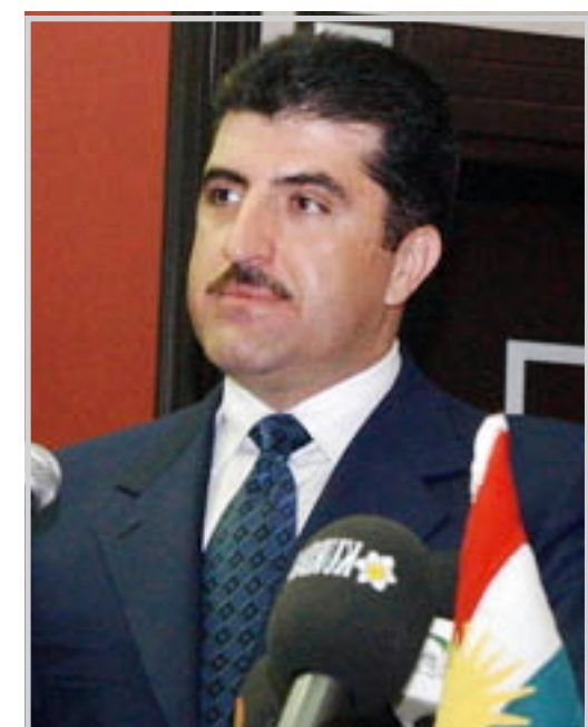
أربيل / KRG:

أكد رئيس حكومة إقليم كردستان نيجرفان بارزاني أن العقود النفطية التي أبرمتها حكومة الإقليم مع الشركات الأجنبية جاءت في إطار دستوري وقانوني مشيراً إلى استعداد حكومة الإقليم لعرض تلك العقود على المحكمة الاتحادية والرأي العام. ودعا في تصريح صحفي رؤساء تحرير الصحف في كردستان إلى عقد اجتماع مشترك مع وزير الثروات الطبيعية في الإقليم بهدف الاطلاع وعرض جميع العقود بشكل شفاف وواضح. وقال بارزاني: إن حكومة الإقليم لا يوجد لديها شيء غامض في تلك العقود وإن ما يقال بشأن منح الشركات التي تم إبرام العقود معها فائدة أكثر لا أساس له من الصحة. مؤكداً بأن حكومة الإقليم لم تمنح في تلك التعاقدات أكثر مما تستحقه تلك الشركات بالمقارنة مع عقود مشابهة في دول أخرى. مشيراً إلى أن الإقليم مستعد لاضافة 100 الف برميل إضافية على صادرات النفط العراقي يوميا.