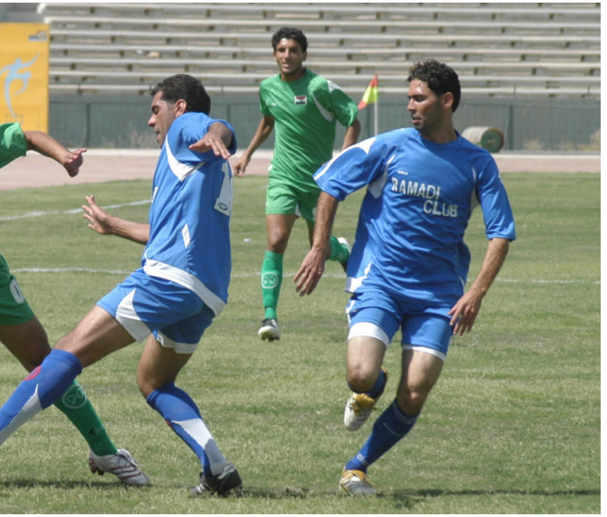
لقطة من مباراة الشرطة والطلبة في منافسات دوري بغداد

ي عقد الاتحاد العراقي المركزي لكرة القدم في محافظة النجف الاشراف صباح اليوم اجتماعه الاستثنائي لمناقشة عدد من القضايا المطروحة على جدول اعماله التي تخص مسيرة المنتخبات الوطنية العراقية وتحديد عدد الفرق المتأهلة الى دوري النخبة للموسم الكروي ٢٠٠٧-٢٠٠٨ وحثه على ضرورة زيادة عدد الفرق المتأهلة الى دوري النخبة سيما في مجموعة بغداد التي شهدت منافسات حامية الويليس بين الفرق لتقاربها في المستوى الفني وكذلك الاعلان عن آلية اقامة دوري النخبة بعد ان تنوعت الآراء والمقترحات من قبل الاندية المتأهلة.