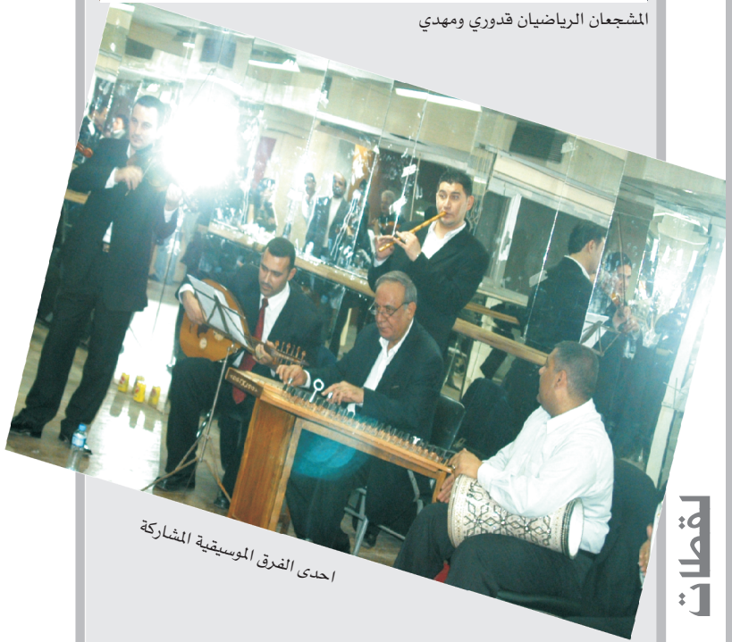
احدى الفرق الموسيقية المشاركة