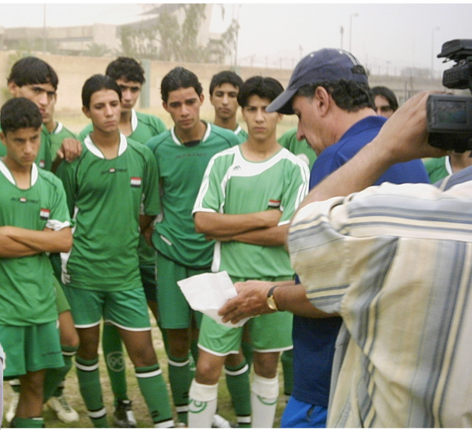
يوأكب عمله تحضيريا لبطولة ناكاتا الدولية

بما يجعلنا دائمى التنقل وهذا يكلفنا الكثير ولكن حب العراق وارتقاع الوعي والشعور الوطني لدى لاعبينا والتزامهم العالي جعلنا نخسر الكثير من المسافات للوصول إلى الجاهزية . وهل هناك مشاركات قادمة للفريق ؟ – اغلب لاعبينا توزعوا الآن بين اندية الدرجة الممتازة والنخبة وينسى من خلال ذلك زيادة خبرتهم الميدانية وان المنتخب نيجيريا الذي خطف البطولة العالمية بعد تغلبه على اسبانيا ٣-٠ صفرة والبرازيل المصنفة الأولى عالمياً إضافة إلى منتخب الإمارات الشاب ولم نخسر إلا بصعوبة كبيرة أمام الإمارات نيجيريا بطله كأس العالم . بماذا أفادتكم هذه البطولة ؟ – لقد رسخت الثقة الكبيرة لدي بلاعبينا الذين يتطور ادأؤهم ويزداد عطاؤهم بمرور الزمن حيث ليس من السهولة مجازاة أي من الفرق المشاركة إذ لم تكن تتمتع بمزايا متقدمة تتيج له الاجتهاد والتألق . كيف كانت أجواء الفريق التدريبي؟ – لم تكن الأجواء التدريبية مثالية وكنا نعاني كثيراً واللاعبين من دون وواتب ولا توجد سيارة لنقل الفريق مثلما نفتقد للملعب في أكثر الأحيان