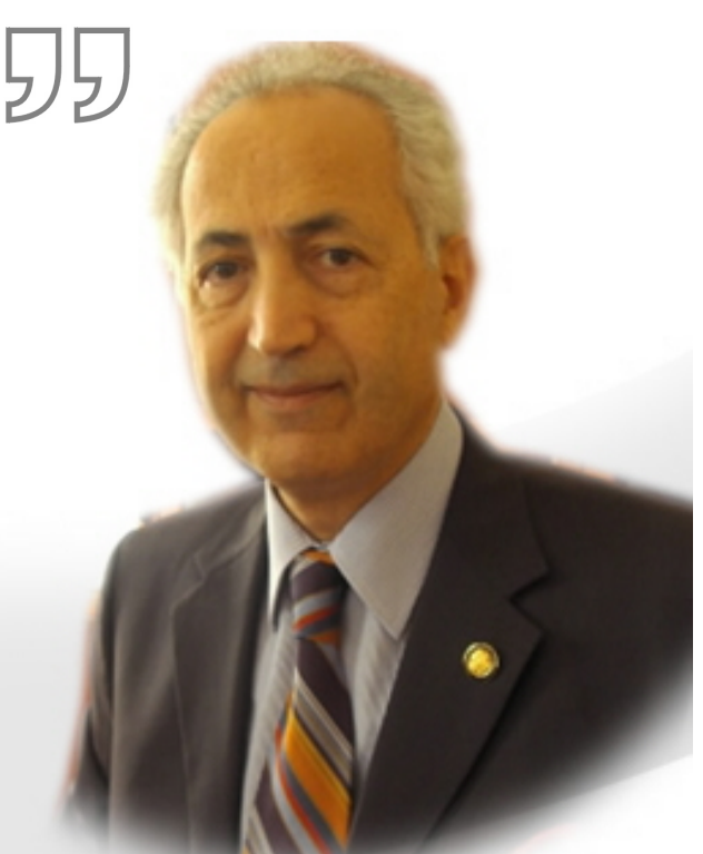
واشنطن