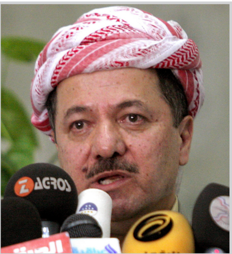
أربيل / الصدا خزين مائي كبير إضافة الى انتاج الطاقة الكهربائية واهميته من التلقى رئيس اقليم كردستان مسعود

بارزاني في اربيل وزير الموارد المائية في الحكومة الاتحادية الدكتور عبد اللطيف جمال رشيد والوفد المرافق له. واستعرض الوزير خلال اللقاء المشاريع المزمع تنفيذها في الاقليم إضافة الى مناقشة اهمية تنفيذ سد بخمة موضعاً الأهمية الكبرى لتنفيذ هذا السد للعراق بشكل عام لما سيوفره من خزين مائي كبير إضافة الى انتاج الطاقة الكهربائية واهميته من