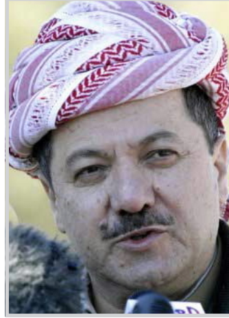
وحضر اللقاء الدكتور فؤاد حسين رئيس ديوان رئاسة الاقليم.

أشكال التعاون. من اجل تطوير هذه العلاقات.