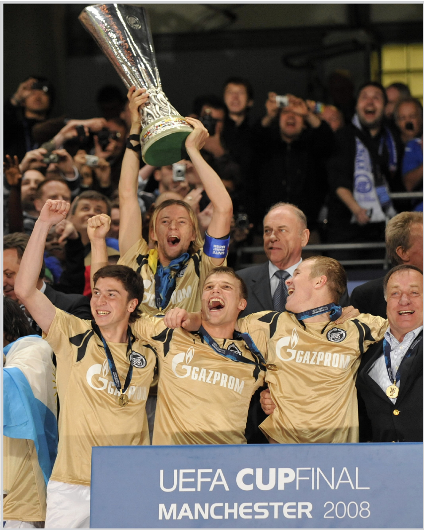
UEFA CUP FINAL MANCHESTER 2008