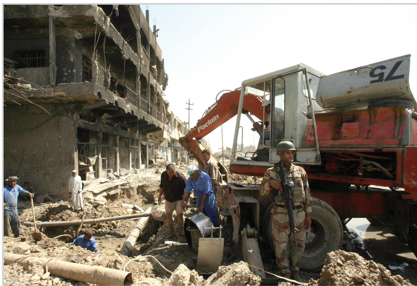
البعد بحملة اعمار مدينة الصدر

بغداد / الصدا أكد رئيس الجمهورية جلال طالباني أن العمليات العسكرية تجري بنجاح ضد الإرهابيين والخارجيين عن القانون مع مراعاة حقوق الإنسان، كما توقع ان تسيطر القوات العراقية على المرفق الأمني في البلاد مع نهاية العام الحالي. وقال طالباني خلال لقائه عضو مجلس العموم البريطاني والمبعوث الخاصة للحكومة