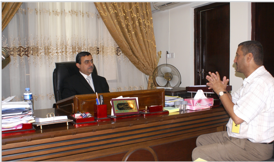
رئيس الجهاز المركزي للاحصاء مع الحرر

القرار، اما بخصوص الوقود وارتفاع اسعارها فنرى ان له آثارا سلبية على مستوى معيشة المواطنين، بل يمكن القول انه اصبح يوازي سلة المواد الغذائية حيث اثر بشكل مباشر على مستوى معيشة رب الاسرة وعليه فيجب ان تاخذ الجهات المختصة توفير الوقود بكل انواعه من اجل استقرار اسعاره بشكل متواصل وعدم تعرضه الى الارتفاع وقد سجلت لنا المؤشرات المتوفرة في الجهاز ان اجمالي الساعات المتوفرة من قبل وزارة الكهرباء بلغت سبع ساعات يوميا لعموم المحافظات وخمس ساعات لمدنية بغداد وهذا له تأثيره على الحياة الاقتصادية برغم الجهود المبذولة من قبل وزارة الكهرباء ❖ كيف يتم احتساب مؤشر التضخم ؟