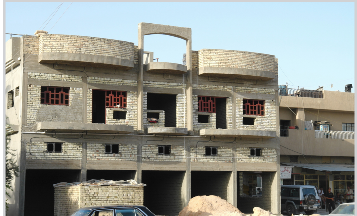
عقارات قيد الانشاء

المقبل، ان نركز على اجراءات محددة، وجنباً إلى جنب مع شركائنا، ستساعد تلك المبادرات في التصدي للخطر الفوري المتمثل في الجوع وسوء التغذية بالنسبة للملايين من بين الأشخاص الذين يكافحون من أجل البقاء وهم في مواجهة ارتفاع اسعار المواد الغذائية، كما ستسهم في إيجاد حل أطول امدا يجب ان يشترك فيه العديد من البلدان والمؤسسات".