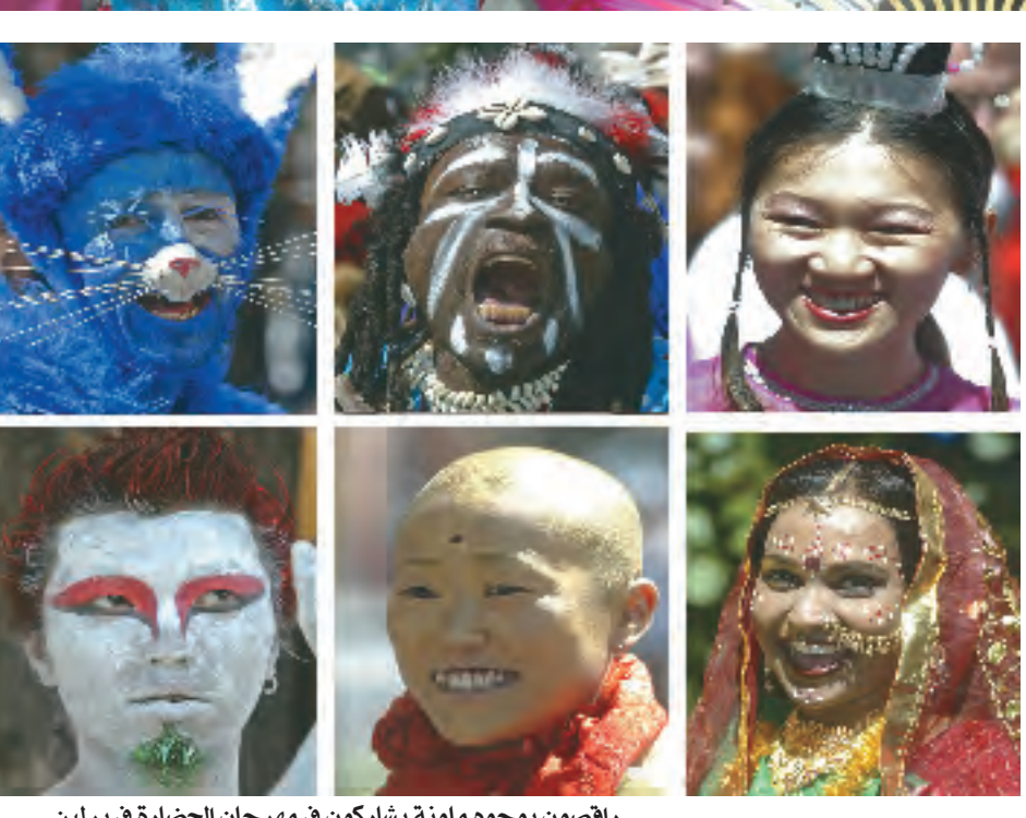
رافسون بوجوه ملونة يشاركون في مهرجان الحضارة في برلين