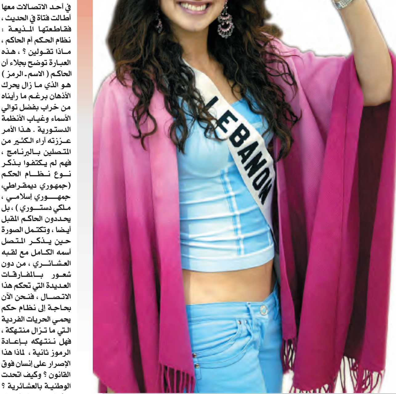
اليوم اختيار ملكة جمال العالم ٢٠٠٤ في الاكوادور

في أحد الاتصالات معها اطالت فتاة في الحديث ، فقاطعتها المذيعة : نظام الحكم أم الحاكم ، ماذا تقولين ؟ ، هذه العبارة توضح بجلاء أن الحاكم (الاسم- الرمز) هو الذي ما زال يحرك الأذهان برغم ما رأيناه من خراب بفضل توالي الأسماء وغياب الأنظمة الدستورية . هذا الأمر عززته آراء الكثير من المتصلين بالبرنامج ، فهم لم يكتفوا بذكر نوع نظام الحكم (جمهوري ديمقراطي، جمهوري اسلامي ، ملكي دستوري ) ، بل يحددون الحاكم المقبل أيضا ، وتكتمل الصورة حين يذكر المتصل اسمه الكامل مع لقبه العائلي ، من دون شعور بالمفارقات العديدة التي تحكم هذا الاتصال ، فنحن الآن بحاجة الى نظام حكم يحمي الحريات الفردية التي ما تزال منتهكة ، فهل ننتهكه بإعادة الرموز ثانية ، لماذا هذا الإصرار على إنسان فوق القانون ؟ وكيف اتحدث الوطنية بالعشائرية ؟ هذا لايعني التشكيك بوطنية العشيرة العراقية ، ولكننا نسعى الى تجاوز حقيقتي لكل ما يتقاطع مع الوطنية ، فلنستأ اليوم أبناء ارياف نريد الاختباء بين طيات الأعراف العشائرية ، وإنما أبناء مدن نسعى لإعادة سلطة القانون التي انتهكت ، ولم تكن الردة العشائرية لتحصل لو أننا حصلنا على نظام حكم دستوري ، ما نبعث عنه مواطنة عراقية لا عشائرية ، ونظام حكم لا نظام حاكم.