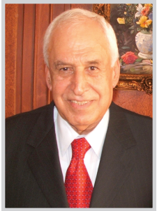
البدري مازال يرى تأهلنا المونديالي قائماً