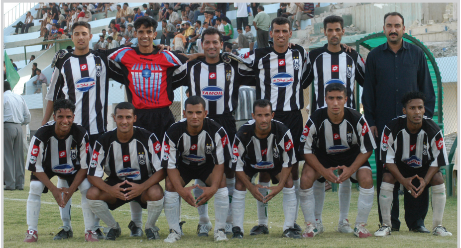
فريق كربلاء يبدأ استعداداته لدوري النخبة

النخبة. وتعد هذه المجموعة صعبة نسبيا لوجود فرق قوية وجميها طامحة لحطف بطاقة التأهل للمربع الذهبي او الصراع على المركز الثاني بانتظار جولة جديدة لاصحاب المركز الثاني في المجموعات الثلاث عندما تخوض دوري من مرحلة واحدة لحطف البطاقة الذهبية والاخيرة باتجاه المربع الذهبي.