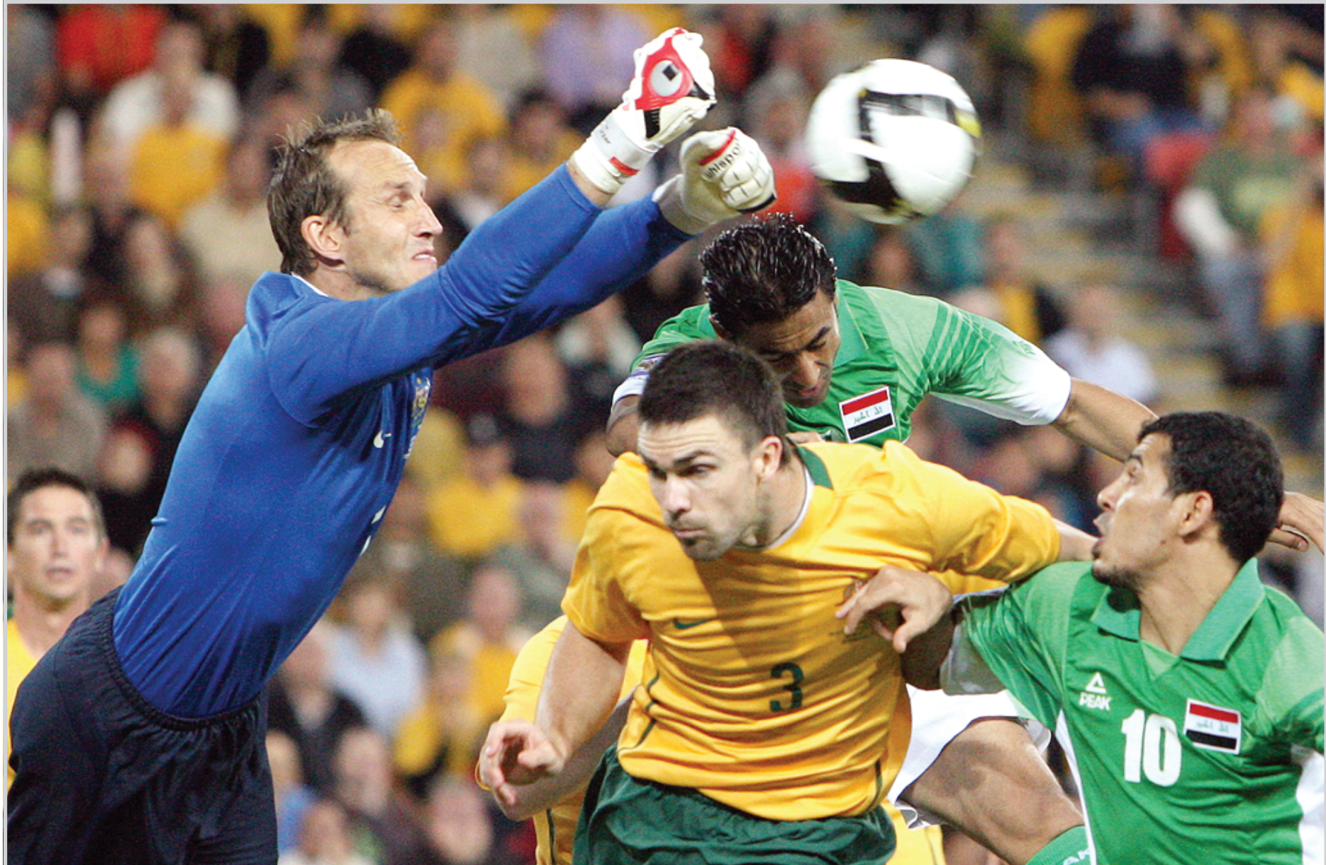
منتخبنا مصمم على تجاوز خفاقة امام استراليا

وتمنى المسؤول في المجلس الاولمبي الاسيوي ان تزول جميع الخلافات السائدة الان في المشهد الرياضي العراقي وان يعود الرياضيون في العراق الى مكانتهم الحقيقية ومشاركاتهم الطبيعية في المحافل الخارجية باسر وقت.