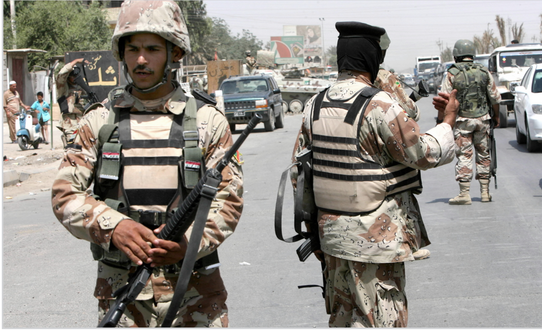
حفظ الامن والنظام في شوارع بغداد

قال مصدر اعلامي في وزارة الدولة للسياحة والآثار ان مدينة كربلاء استقبلت (١٩١٨٢١) زائراً خلال اشهر آذار ونيسان وايار في حين يتوقع خبراء السياحة ان العدد قد يصل الى مليون زائر نهاية العام الحالي. مشيراً الى ان عدد الزائرين شهد تذبذباً ملحوظاً خلال الاشهر الثلاثة الماضية بسبب العمليات العسكرية في مدينة البصرة وتوردي الاوضاع الامنية في المحافظات المقدسة اثر ذلك. وأشار الى ان مدينة كربلاء استقبلت ١٢٢٦٢٢ زائراً خلال شهر آذار في حين انحسر هذا العدد خلال شهر نيسان ليصل الى ١٥٩٢٦ زائراً الا ان الامر سرعان ما تغير ليقتصر عدد الوافدين الى المدينة خلال شهر ايار الى (٥٢٣٣٣) وافداً. ولح المصدر الى ان الزائرين خلال شهر آذار مثل قمة في الجداول الاحصائية خلال ثلاثة اشهر بسبب مصادفة زيارة الاربعة خلال هذا الشهر. مضيفاً ان المناسبات الدينية اهم العوامل التي تسهم في ارتفاع عدد الوافدين الى العراق. وعلى الصعيد نفسه، اشار مسؤول شعبة المتابعة في سياحة كربلاء الى ان هيئة الاستثمار المحلية في المدينة تعمل على تطوير المدينة سياحياً من خلال جلب الاستثمارات العربية