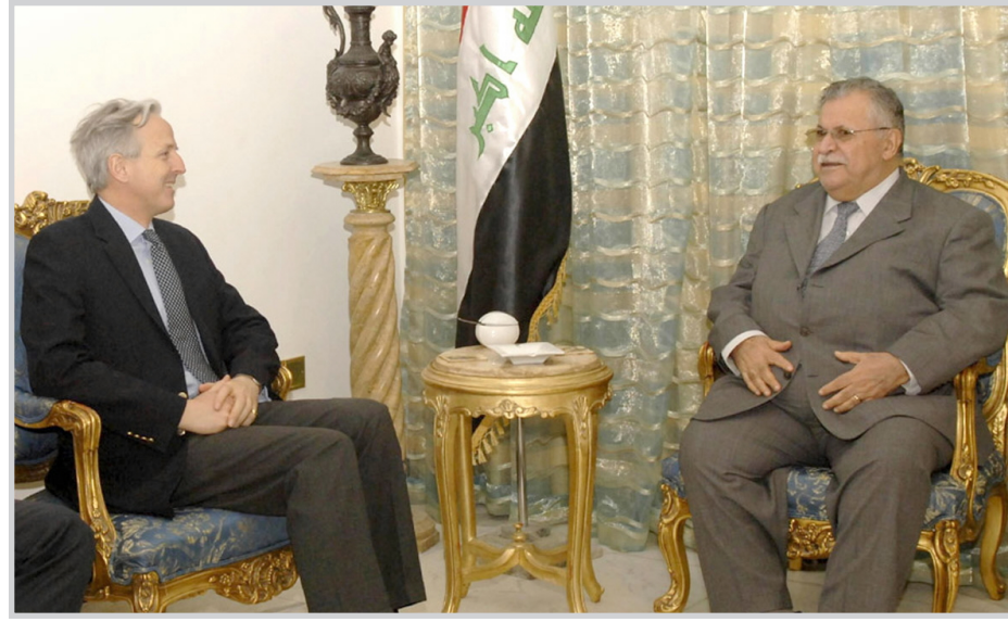
الرئيس طالباني مع السفير البريطاني

وجاء في نص البرقية التي حصلت (المدى) على نسخة منها: بمناسبة ذكرى تأسيس الاتحاد الوطني الكردستاني تقدم لكم بأطيب التهاني واني اذ أستذكر مسيرتكم التضالية الحافلة، هذه المسيرة الهادفة الى تحرير العراق من الحكم الضروي الاستبدادي والسعي الى العمل على بناء عراق ديمقراطي فيدرالي تسود المحبة بين جميع مكوناته وشرائحه. كما تلقى الرئيس طالباني برفقة تهنئة من أمين بغداد صابر العيسوي بمناسبة تأسيس الاتحاد الوطني الكردستاني. وجاء في نص البرقية: بمناسبة ذكرى تأسيس الاتحاد الوطني الكردستاني و ما حملته مسيرة الحزب من نضال وتضحيات كبيرة قدمتموها على طريق الحرية والتحرير لايسعني الا ان اتقدم لضخامتكم ومن خلالكم لكل مناضلي الحزب بأحر التهاني والتبريكات متمنين لكم دوام الصحة والعافية و لكردستان الحبيبة الازدهار والتقدم و لعراقنا الجديد كل خير ونجاح.