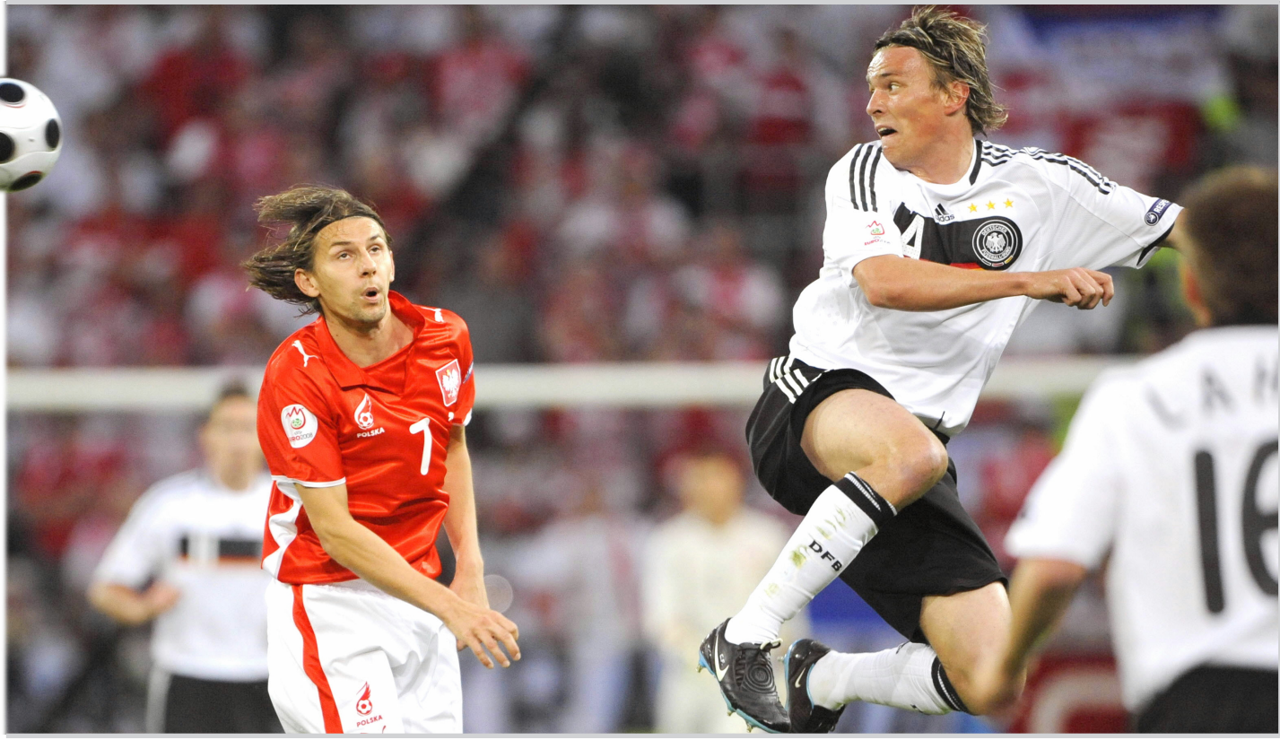
المانيا تبحث عن تجديد حظوظ الفوز أمام الكروات

ستتأهل لهذا الدور ولذالك وضع المديران يواخيم لوفه،مدرب المنتخب الألماني وسلافان بيليك،مدرب منتخب كرواتيا حساباتهما لهذه المباراة بدقة...لأنهما يعرفان جيدا بان نتيجتها ستحسم وينسبها عالية، شكل الترتيب النهائي لهذه المجموعة،ولذلك سيعتمد يواخيم على نفس التشكيلة التي لعب بها في مباراته الأولى مع بولندا وفاز على البولنديين فيها ٢/٠ صفر،ولكن هذا التشكيل الذي اعتمد مبدأ الهجوم بوضعه ثلاثة مهاجمين في الثلث الهجومى الألماني وتمثل باللاعبين كلوزه،ماريو غوميز ولوكاس بودولسكي الذي احرز هدفي ألمانيا،ولكن هذا المبدأ ربما نجح مع منتخب بولندا ولكنه لا يمكن له ان ينجح مع كرواتيا،الذي يلعب سبعة من لاعبيه في الدوري الألماني ويمثلون قوة هجومية لأندية هامبورغ،الذي يرتدي فانيلته المهاجم أوليش،ونادي بروسيا دورتموند،الذي احرز له مهاجم المنتخب الكرواتي ملادين بيتريك ١٣ هدفا في هذا الموسم،وهو أفضل ثالث(سكور) في (البوندسليغا) لهذا الموسم،وهيرنا برلين الذي يلعب له المهاجم نيكو كوفاك،وفيردر بريمن والذي يعتمد في الكثير من تفاصيله الهجومية على الهدف ايفان كلانيتش،،أضافة الى هؤلاء اللاعبين هناك ايضا المدافع رومان كوفاك ولاعبى خط الوسط ريكيتش وسيمونيك،والأكثر من ذلك سبق ولعب المدرب الكرواتي في الدوري الألماني ايضا،ولهذا يمتلك القدرة على إيقاف (الماكينات) الألمانية لأنه يعرف الكثير عن (قطع الغيار) الخاصة في هذه الماكينات،ومن هنا تأتي المخاوف الألمانية في مباراة اليوم لأنهم يعرفون جيدا بانهم سيواجهون منتخبا جاهزا للدفاع عن سواحل بحر الأدرياتيك من اي هجوم الماني