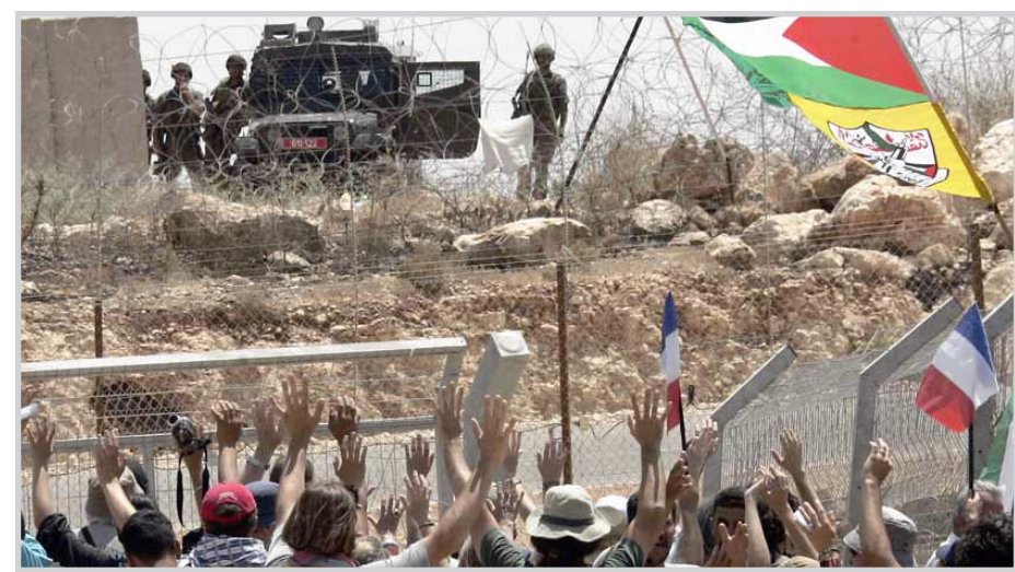
احتجاجات عند حاجز في غزة