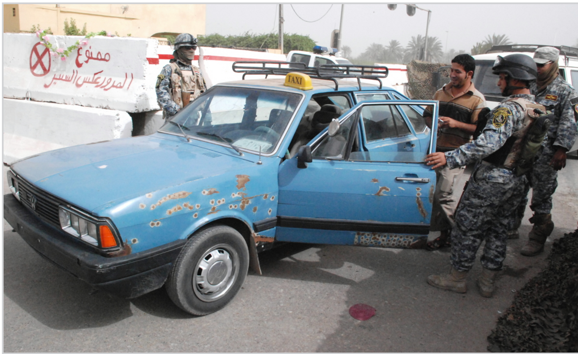
سيطرات حفظ الامن والنظام في بغداد..

وكان السامرائي، وزير الكهرباء الأسبق في حكومة ابياد علاوي والمتهم في قضايا اختلاس ملايين الدولارات، أعلن امس الاول في