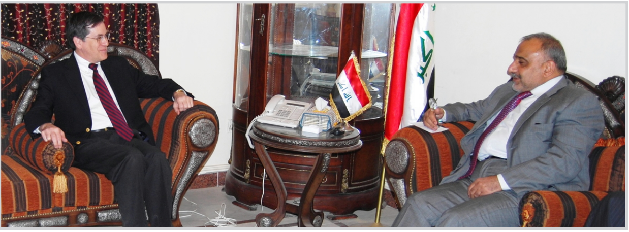
عبد المهدي مع المسؤولين الأمريكيين

استقبل نائب رئيس الجمهورية عادل عبد المهدي في مكتبه ببغداد امس الثلاثاء السفير ديفيد ساتر فيلد ومبعوث البيت