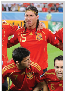
اسبانيا تحصد العلامة الكاملة في ختام الدور الأول

رئيس الاتحاد يتفقد بعثة المنتخب.. والمدرّب يلتمس دعم الجماهير