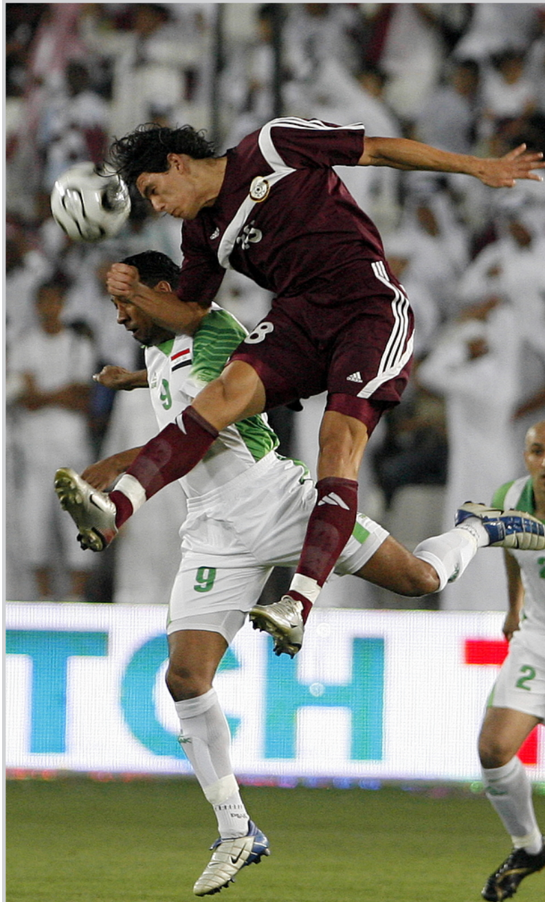
قضي منير في صراع على الكرة مع سوريا في لقاء الدوحة

يغلب على محياه ، حينما سألته عن اللقاء اجاب بالحرف الواحد طبعاً. متفائل وإن شاء الله ستحقق الفوز ، وتزف