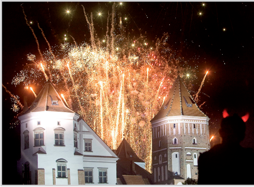
الاعجاب النارية تثير سماء قرية مير