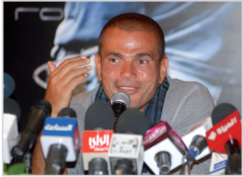
نجم الجوب المصري عمرو دياب في مؤتمر صحفيا لاعلان تعاقد مع قناة روكانا