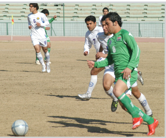
إمتحان صعب للشرطة لتأكيد الجدارة