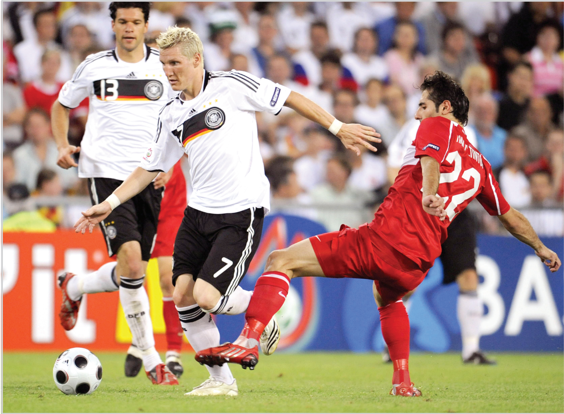
ملحنة اورية لفرض السيادة الكروية بين الماتادور والماتادور في نهائي فيينا التاريخي

اراغونيس على خط دفاعي صلب بقيادة كارليس بويول وكارلوس مارشينا، لكن قوته الضاربة تتركز في خط الوسط بوجود شاي هرنانديز وزميله في برشلونة اندريس انيستا ولوب الحركة دافيد سيلفا إضافة الى سينا قوي البنية.