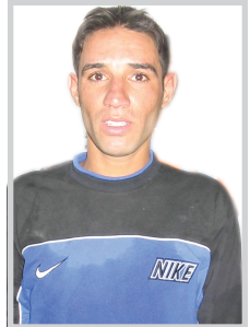
صبار يقرق سفينة المنافسة