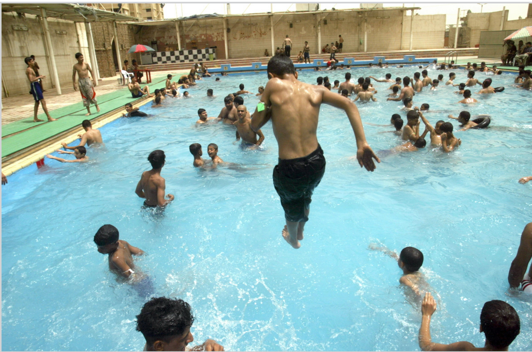
قفزة في الماء البارد

ميسان / وعد شاكر أعلن الناطق الإعلامي لمحافظ ميسان ان محافظة ميسان حققت نسبة صرف تقدر بـ ٤٨ ٪ من تخصيصات تنمية الأقاليم لعام ٢٠٠٨ وبذلك تكون المحافظة قد تجاوزت النسبة التي حددتها وزارة المالية، البالغة ٢٥ ٪ منح موازنة تكميلية.