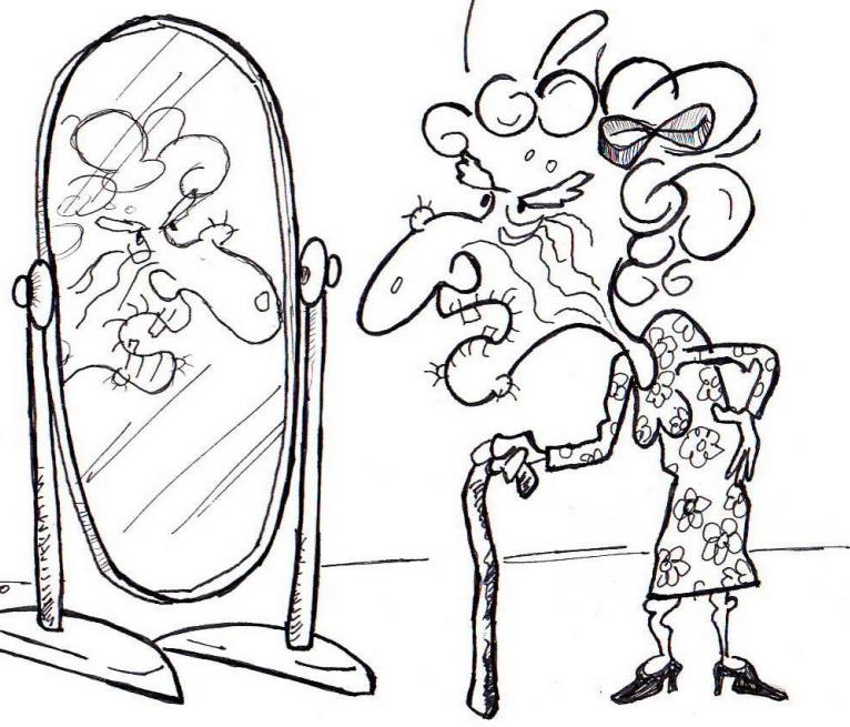
بريشة قاسم حسين