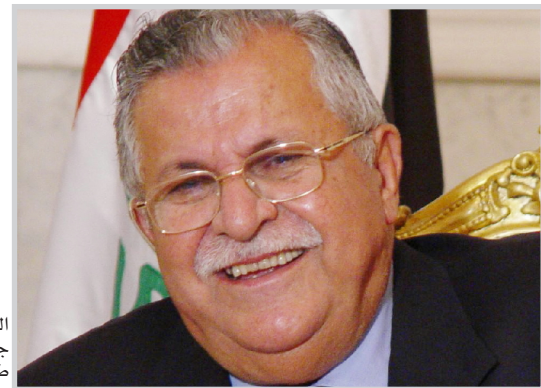
الرئيس جلال طالباني

بغداد / الهدى بعث رئيس الجمهورية جلال طالباني برسالة تهنئة، إلى رئيس الولايات المتحدة الأمريكية جورج بوش، بمناسبة عيد الاستقلال جاء فيها: الصديق جورج دبليو بوش