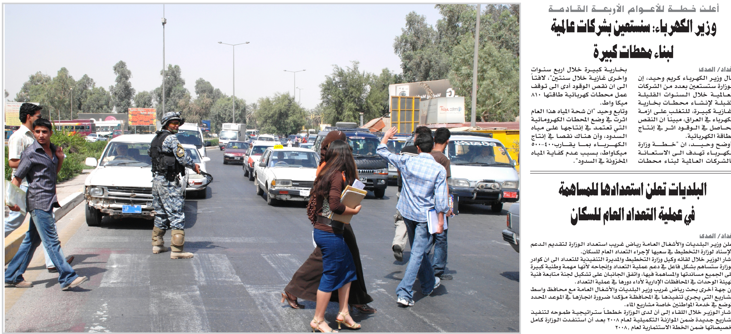
حفاظاً على سلامتهم

بغداد / الهدى قال وزير الكهرباء كريم وحيد، إن الوزارة ستستعين بعدد من الشركات العالمية خلال السنوات القليلة المقبلة لإنشاء محطات بخارية وغازية كبيرة، للتغلب على أزمة الكهرباء في العراق، مبيناً أن النقص الحاصل في الوقود اثر في إنتاج الطاقة الكهربائية. وأوضح وحيد، ان "خطة وزارة الكهرباء تهدف الى الاستعانة بالشركات العالمية لبناء محطات