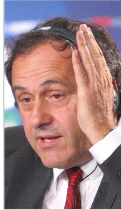
بلاتيني يشيد بنهج المنتخبات الهجومية

وأضاف بلاتيني أحد أشهر النجوم الذين ارتدوا الفئاضلة رقم (10): لا أستطيع أن أخفي إعجابي وحيي وتقديري للمنتخبات التي تلعب كرة هجومية رائعة.. ألمانيا، إسبانيا، روسيا وهولندا، واعتقادي الشخصي أن كرة المنتخبات الوطنية لها طعم ثان مختلف عن كرة الاندية، فالعواطف الجياشة والانفعالات الإيجابية فيها تشجع على ازدهار رياضة كرة القدم. واستطرد بلاتيني قائلاً: معروف للجميع ان المنتخبات الوطنية هي التي منحت الشهرة والصيت والأضواء للنجوم الكبار ولهذا فإن بيليه ومارادونا ونجوماً آخرين أصبحوا أكثر شهرة من غيرهم بفضل إنجازاتهم مع منتخبات بلادهم أكثر من إنجازاتهم مع أنديةهم. وردا على سؤال عما إذا كان نجاح البطولة يجب في مصلحة اللاعبين أو انه انحصار للاعبين، قال بلاتيني: كرة القدم ملك للاعبين الذين يمارسونها، وعلى (الكوتش أو المدرب) أن يقف خلف الفريق لكي يساعده ويحميه، أما اختياره، ففني تقديري