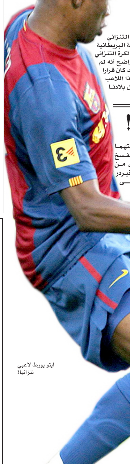
إيتو يورط لاعبي تنزانيا

جديد له ، تراجع اتحاد الكرة التنزاني عن موقفه. ونقلت هيئة الإذاعة البريطانية (بي بي سي) عن رئيس اتحاد الكرة التنزاني ليوديجار تينجا قوله، من الواضح أنه لم يستطع رفض طلب إيتو.. وقد كان قرارا حكيما أن يمنح قميصه لثل هذا اللاعب الشهير، فهذا الأمر سيحجز بلادنا معروفة.