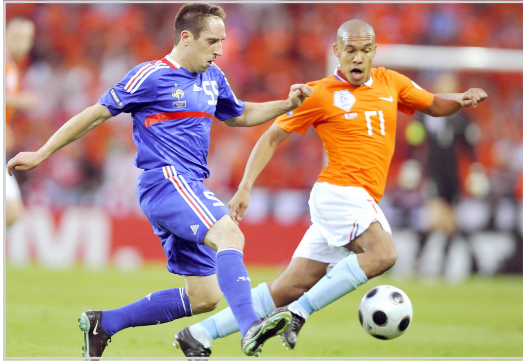
جانب من لقاء فرنسا وهولندا في أمم أوروبا 2008

مقتعاً في أغلب المباريات ووصولها الى المباراة النهائية مستحق، ولكن مسألة استحقال أي لاعب من هذين المنتخبين لجائزة الكرة الذهبية قد يشوبها بعض الشكوك. وعاد بلاتيني ليكر من جديد في هذا الحوار رفضه لثكرة استخدام (الفيديو) أو الاعتماد عليه في كشف وتحديد أخطاء التحكيم، على اعتبار أن ذلك أمر غير مفيد للعبة، بل إنه يفسد المباريات. وفي ختام الحوار أكد بلاتيني سعادته الغامرة بنجاح البطولة الأوروبية لكرة القدم، أداء الألمان والإسبان الهجومي كان