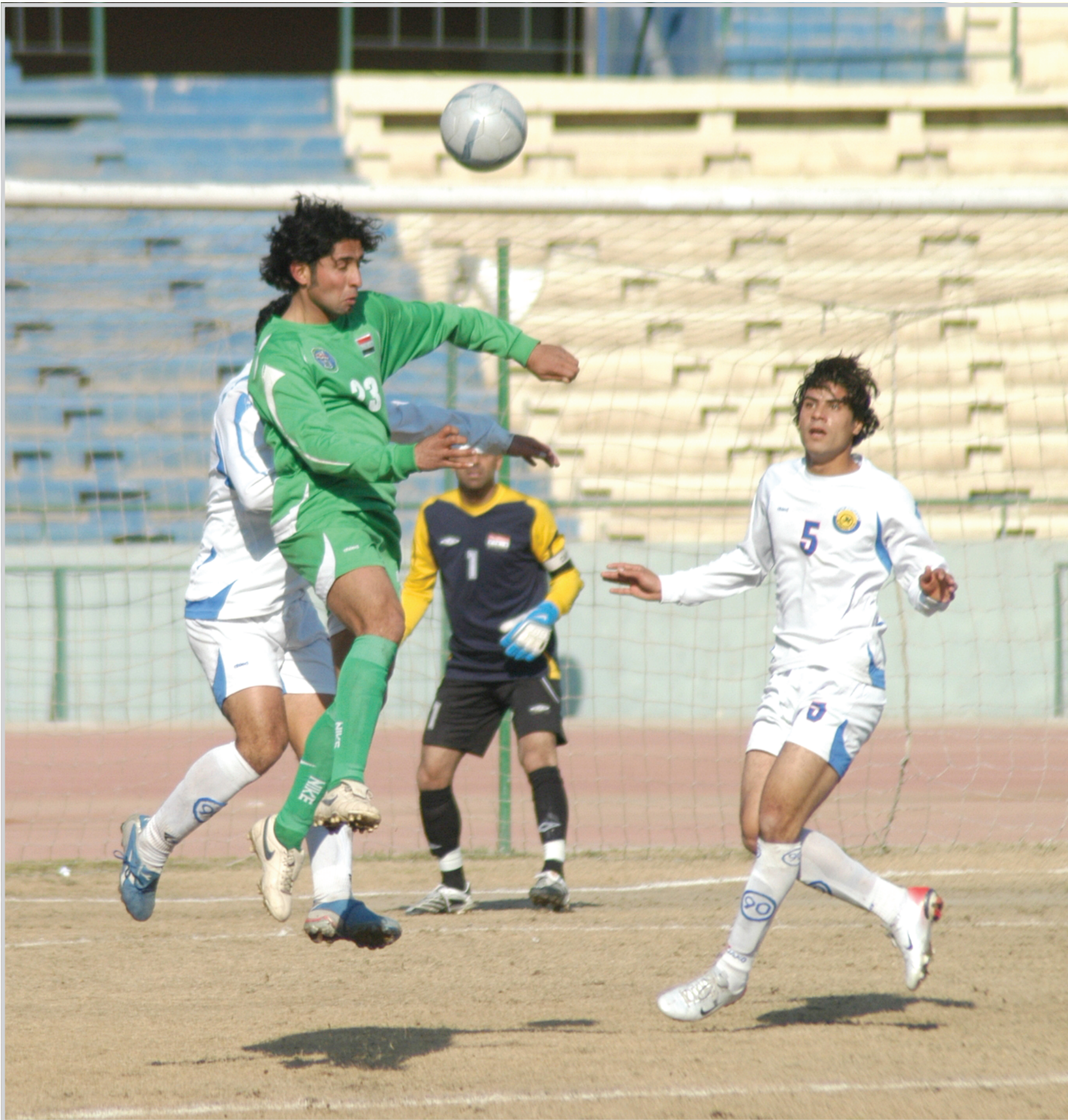
لقاء الشرطة والزوراء... هل يغير حسابات المجموعة الثالثة