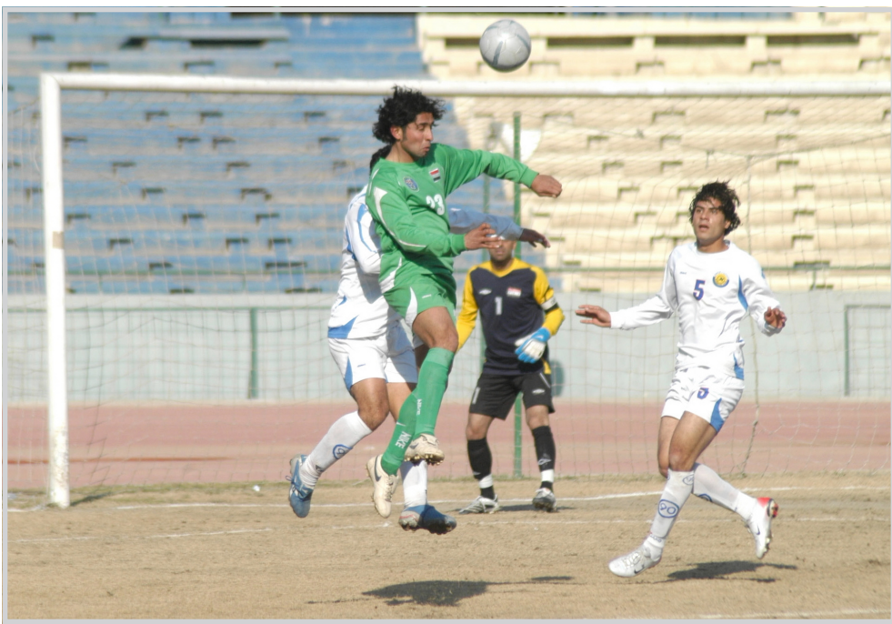
الزوراء يواجه خصمه الشرطاوي بمعنويات عالية