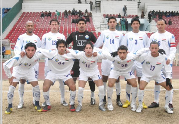
الطلبة انتزع ثمن النقاط في مجموعته

بعد جهود بذلتها ادارة النادي والجهز التدريبي لتعديل نفسية اللاعبين واللعب بروحية الفوز والمهم ان البداية كانت جيدة والنقاط الثلاث اعطت الجميع الثقة في ان يكون التقدم افضل واني احوال ان اكمل ما بدأه حبيب جعفر وكريم صدام في تدريب الفريق وسيكون قادمانا افضل بالرغم من صعوبة المهمة . و اضاف زكي: ان جهودنا ستنبص صافرته بفوز فريق الطلبة بهدف واحد وحصوله على أعلى ثلاث نقاط بعهد المدرب نبيل زكي. اقوال المدرب: قال نبيل زكي مدرب فريق الطلبة بعد انتهاء المباراة: ان فوزنا جاء