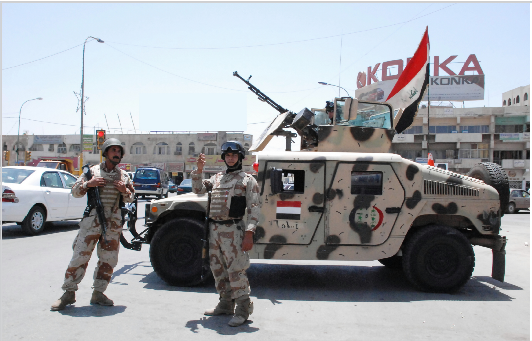
سيطرات أمنية في بغداد.. عسمة سعد الله الخالدي

قال مصدر أمني مسؤول في محافظة نينوى إن قوات الأمن اعتقلت، الاثنين، ثلاثة من المشتبه باختطافهم طالبتين في الدراسة الاعدادية كانتا قد اختطفتا الأحد على يد مسلحين مجهولين أثناء تأديتهما امتحاناتهما النهائية في المحافظة. وأوضح المصدر، الذي طلب عدم ذكر اسمه أن "قوات الأمن اعتقلت امس ثلاثة من المشتبه بهم امس باختطافهم طالبتين في مدرسة إعدادية في منطقة الحدباء شمالي مدينة الموصل أثناء توجههما لتأدية امتحاناتهما النهائية في قضاء تليكياف". وأضاف المصدر انه تم فتح تحقيق مع المشتبه بهم لمعرفة تفاصيل أكثر.