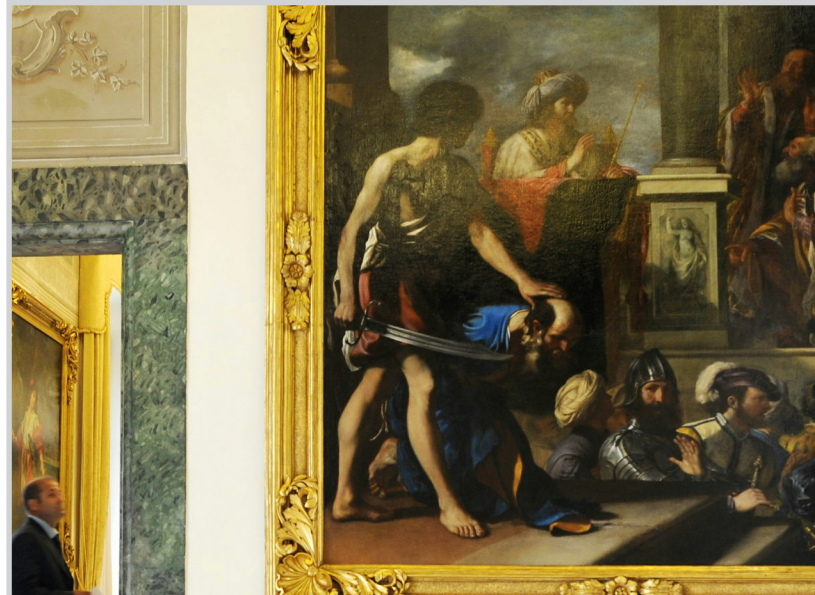
رجل ينظر العا صورة الباروكي الايطالي جورسينو في روما