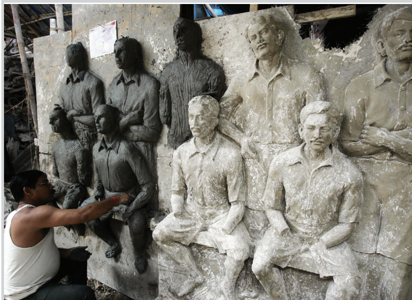
فنّان هندي في أثناء نحتة لوحة تضم لاعبي كرة القدم لعام 1911