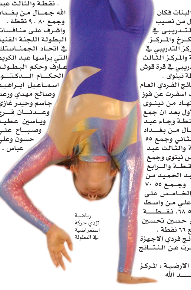
رياضية تؤدي حركة استعراضية في البطولة