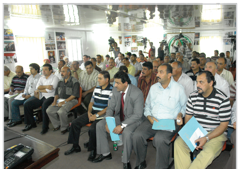
جانب من حضور الهيئة العامة للاتحاد في أحد مؤتمراته