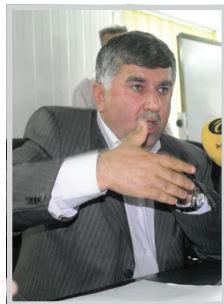
موسى يوسف الاستقالة