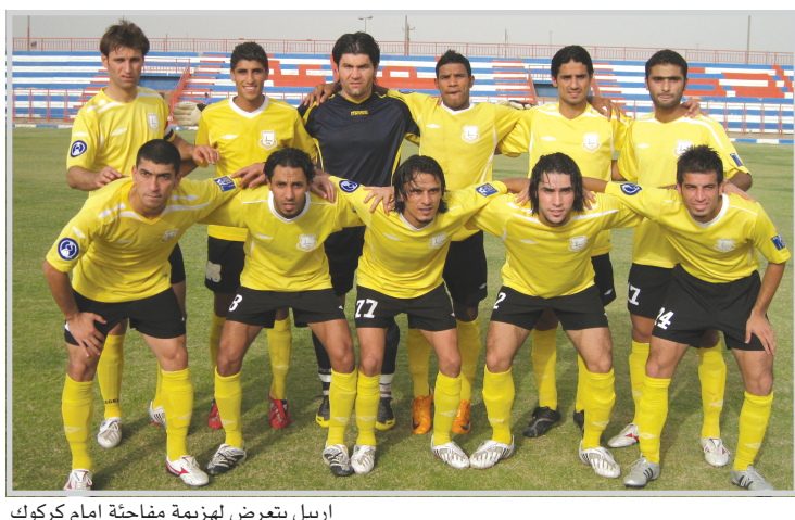
اربيل يتعرض لهزيمة مفاجئة امام كركوك