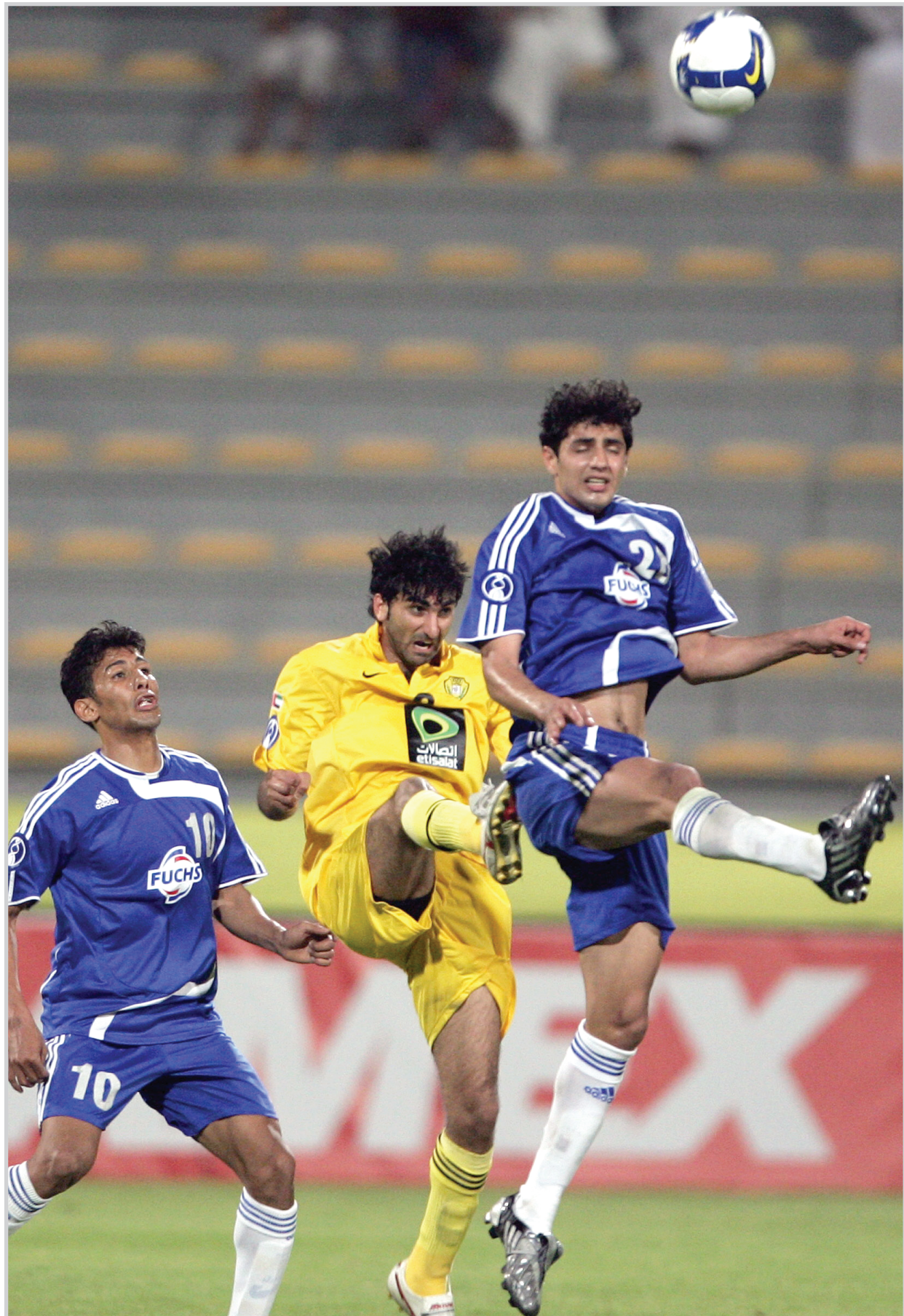
جانب من احدى مباريات فريق القوة الجوية في دور ابطال اسيا