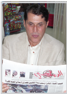
برازيلي يشرف الكرة العراقية في لبنان